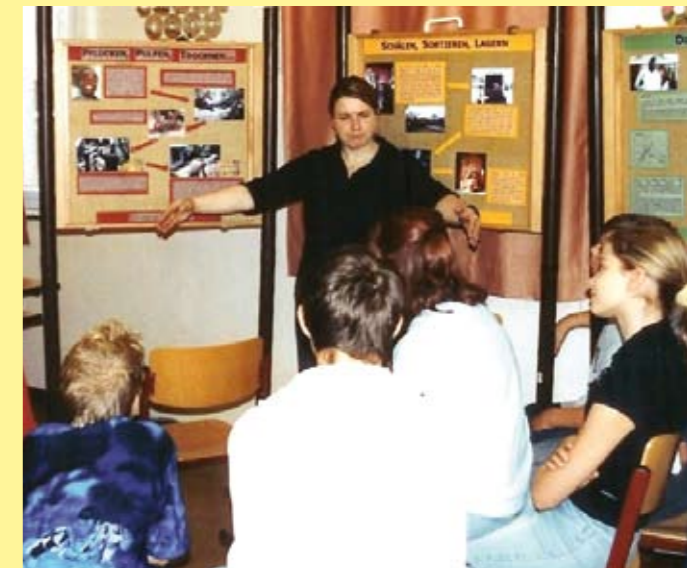
Arbeit zum Thema Welthandel am Beispiel Kaffee mit einem Lernpaccours

Das Kernstück des Materials ist ein Klassensatz authentischer biographischer Geschichten von Menschen in Sansibar. Enthalten ist eine Lehrermappe mit Anleitungen und Ideen für Projekttag und den Regelunterricht.