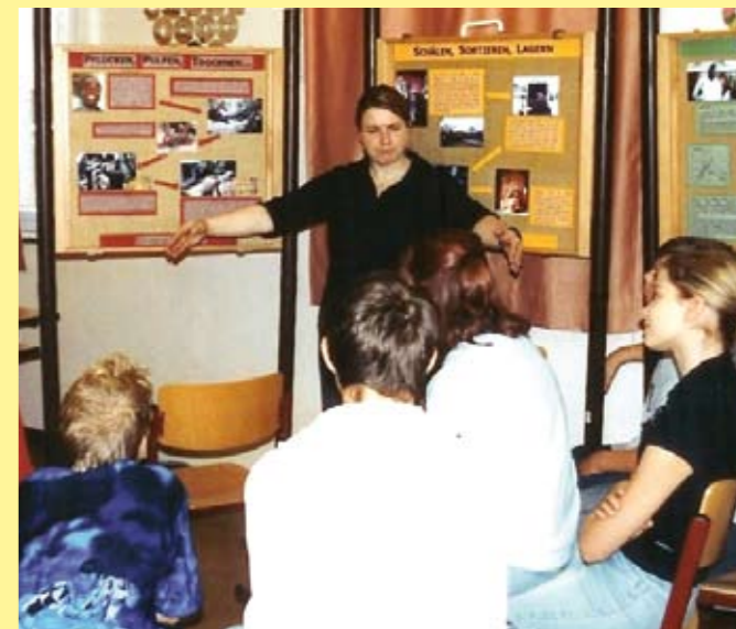
Arbeit zum Thema Welthandel am Beispiel Kaffee mit einem Lernpaccours

Das Kernstück des Materials ist ein Klassensatz authentischer biographischer Geschichten von Menschen in Sansibar. Enthalten ist eine Lehrermappe mit Anleitungen und Ideen für Projekttag und den Regelunterricht.